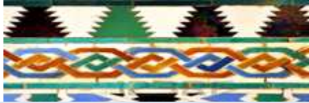
Le Palais de l'Alcazar et ses jardins : Magnifique Palais Royal du Xème siècle