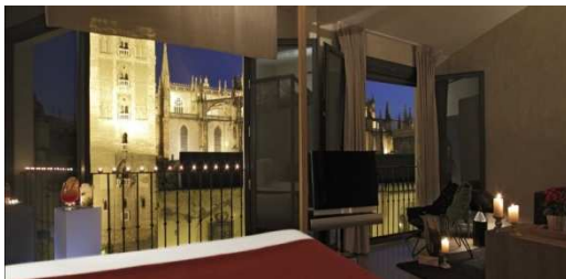
EME CATEDRAL HOTEL*****

Réservation impérative par le formulaire de réservation à renvoyer à reservas.gran.melia.colon@melia.com avant le 12 mai - Attention aux conditions d'annulation