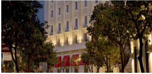
GRAN MELIA COLON HOTEL*****

Ils sont tous proches du lieu du séminaire