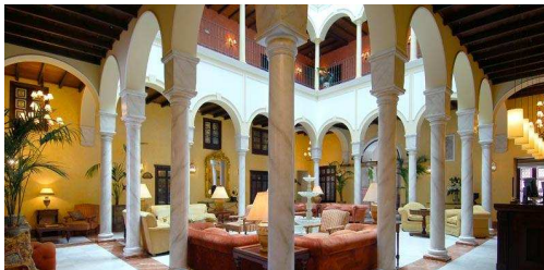
HOTEL VINCCI LA RABIDA****