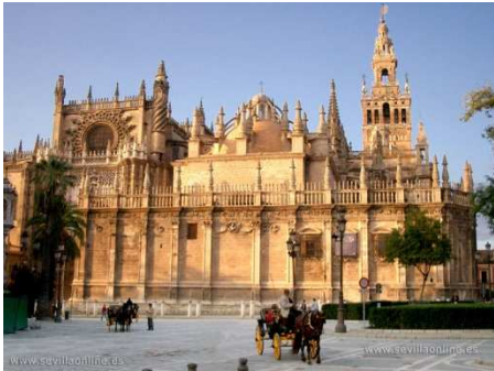
La Cathédrale: majestueuse et de pur style gothique, érigée à la fin du XVème siècle