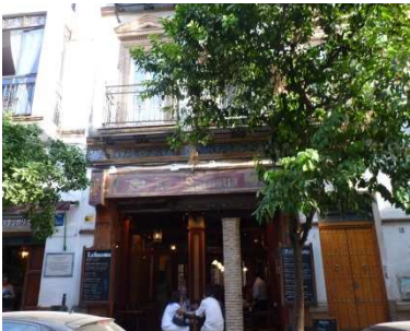
Ballade dans le pittoresque quartier de Santa-Cruz

En fin d'après-midi, visite du Musée du Flamenco et spectacle d'une durée de 45mns